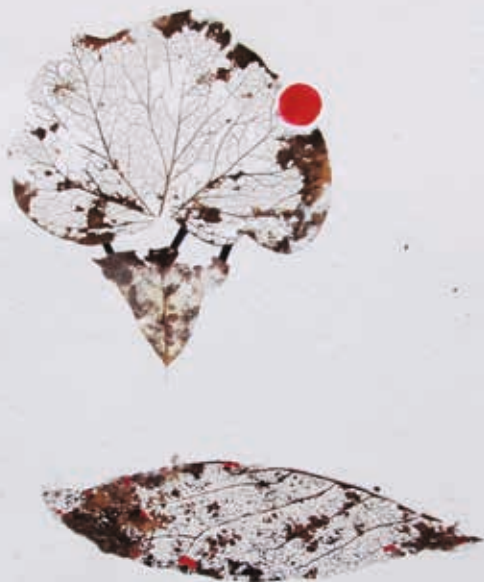
Rot-Schwarz-Blatt, 2017, Recyclingbüten, Blattskelette, Aquarell, 29,7 x 42 cm

Ausstellung vom 19. 8. 2018 bis 23. 9. 2018